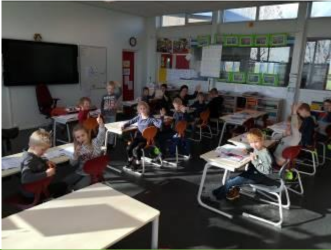
Groetjes uit groep 4/5!